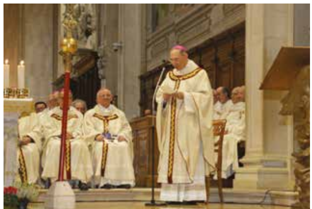
Il saluto di Mons. Gardin al nuovo Vescovo Tomasi

La celebrazione eucaristica che ora presiederai, Mistero pasquale di Cristo crocifisso e risorto, esprima la nostra comune gioia di appartenere a Lui, e sia per noi certezza che il Signore cammina in mezzo a noi".