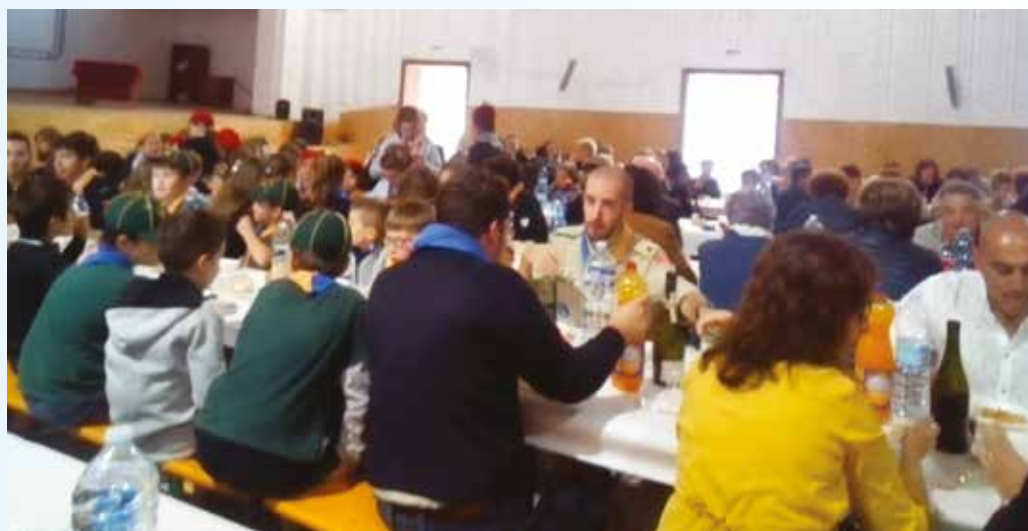
Pranzo comunitario in Oratorio