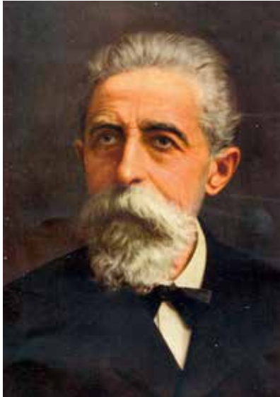
Giuseppe Toniolo (Treviso 1845 - Pisa 1918) Primo presidente dell'Ufficio Centrale.

Lettera del Segretario di Stato, Cardinale Merry del Val, ai componenti dell'Ufficio Centrale dell'Unione Popolare fra i cattolici d'Italia in riscontro alla lettera da loro inviata al Santo Padre, alcuni giorni prima dell'inaugurazione a Firenze dell'Ufficio stesso.