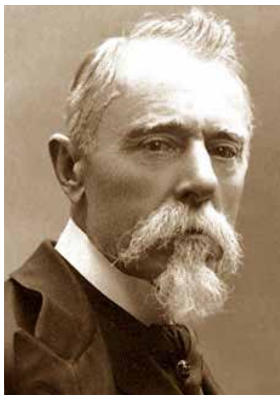
Ernesto Teodoro Moneta (1833 - 1918) Premio Nobel per la Pace nel 1907