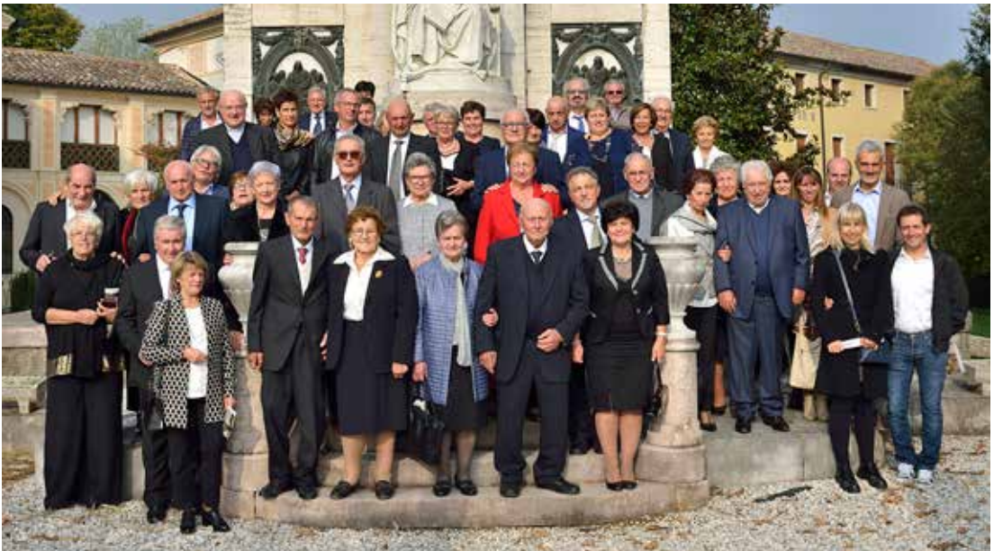
Foto di gruppo al Monumento Spagnolo

Al termine il parroco ha consegnato ad ogni coppia presente la pergamena preparata appositamente dalla diocesi di Treviso in collaborazione con "Famiglia Cristiana" con riportato l'anno di matrimonio conseguito e questo momento è stato immortalato dalle immancabili foto di rito.