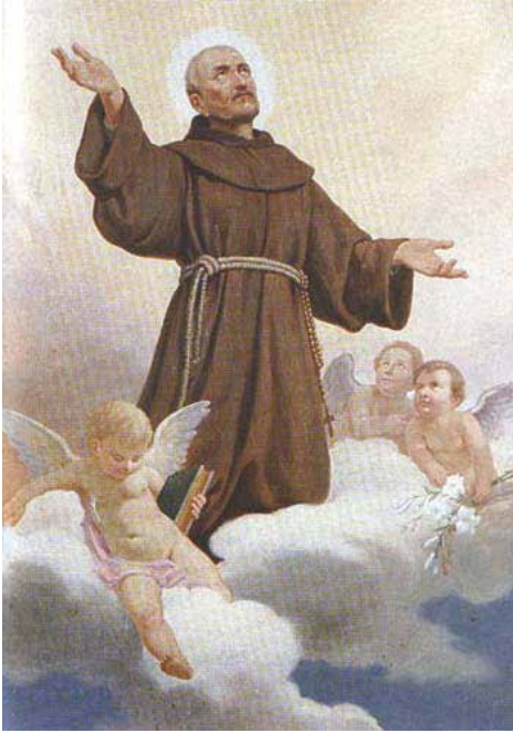
Fra Bonaventura da Barcellona (Michele Battista Gran Peris 1620 - 1684) fondatore della Ri- formella francescana. Beatificato nel 1906 da Pio X.