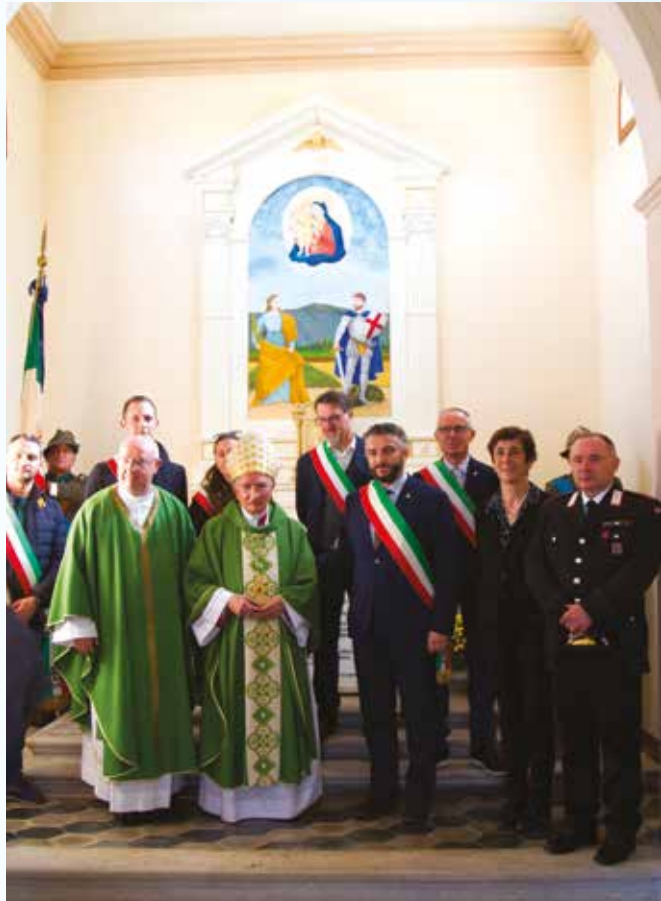
Interno della Chiesa