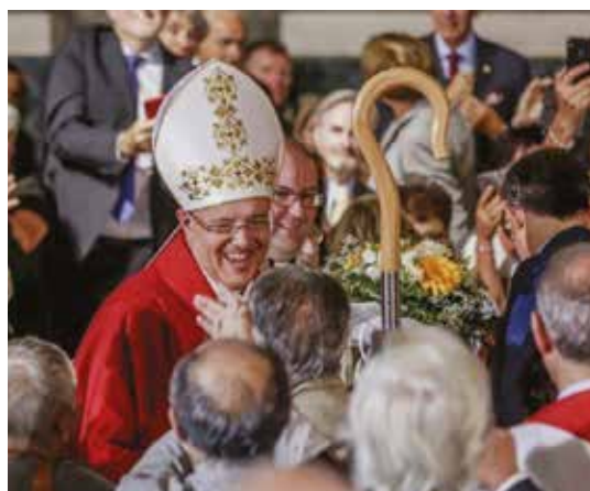
Mons. Michele Tomasi, saluta i fedeli

“La dettagliata descrizione della missione del Vescovo che il rito dell’ordinazione prevede e che fra poco ascolteremo sarebbe un fardello insopportabile per l’uomo se non fosse sempre preceduta dal suadente richiamo della grazia alla libertà, che si esprimerà fra poco nel no-